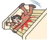
階段から落ちてケガ