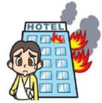
旅行中のケガ（国内外）